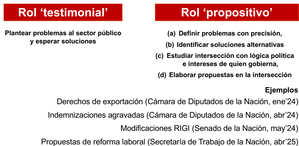
Figura 3: roles testimonial y propositivo

A continuación, algunos casos de éxito que pueden servir para comprender el avance de la migración del rol testimonial al rol propositivo.